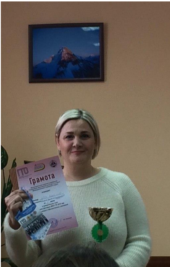
ЛИЦЕЙ 20 - ПОБЕДИТЕЛЬ ЗИМНЕГО МУНИЦИПАЛЬНОГО ФЕСТИВАЛЯ ВФСК ГТО!!!!